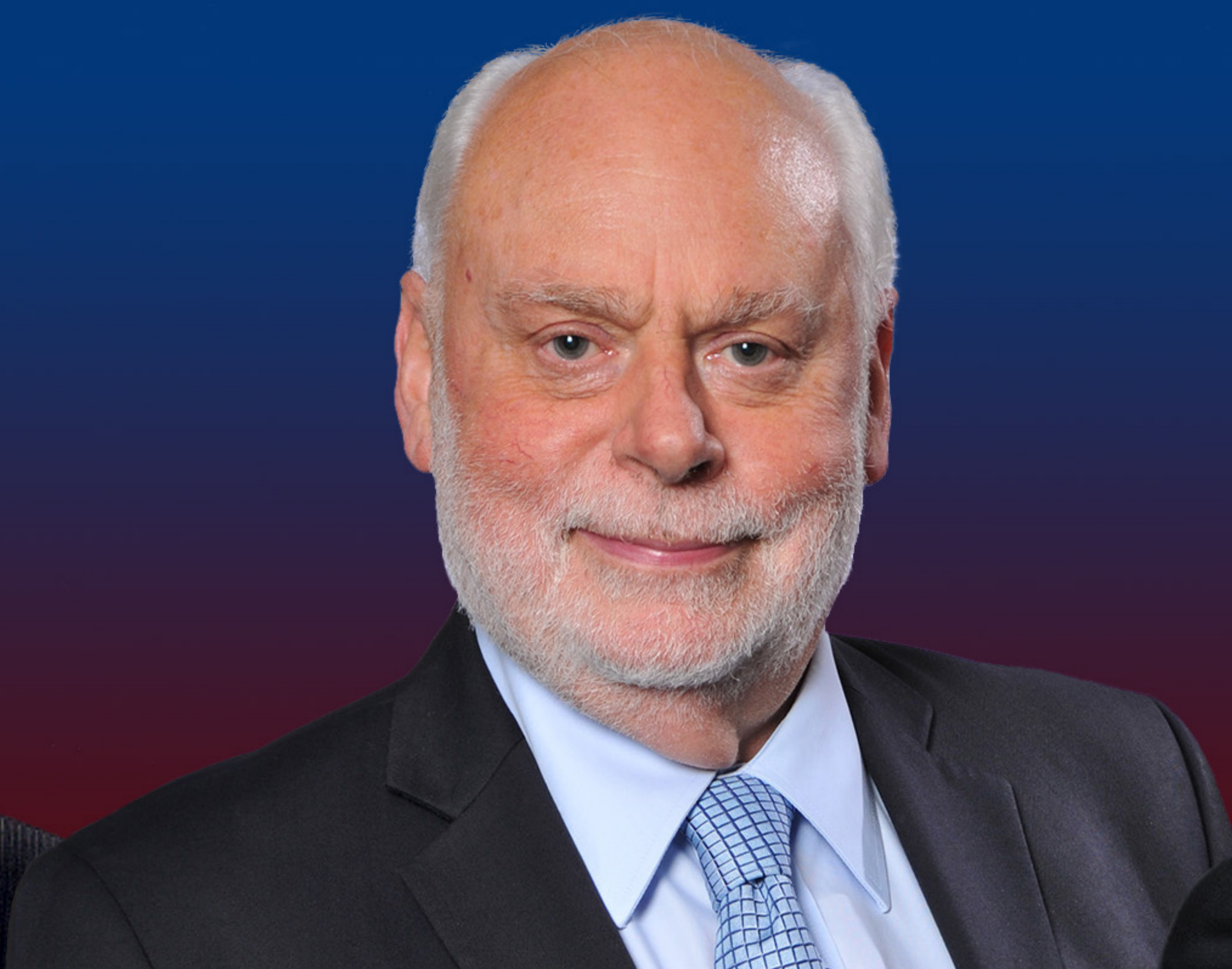
J. Fraser STODDART Northwestern University