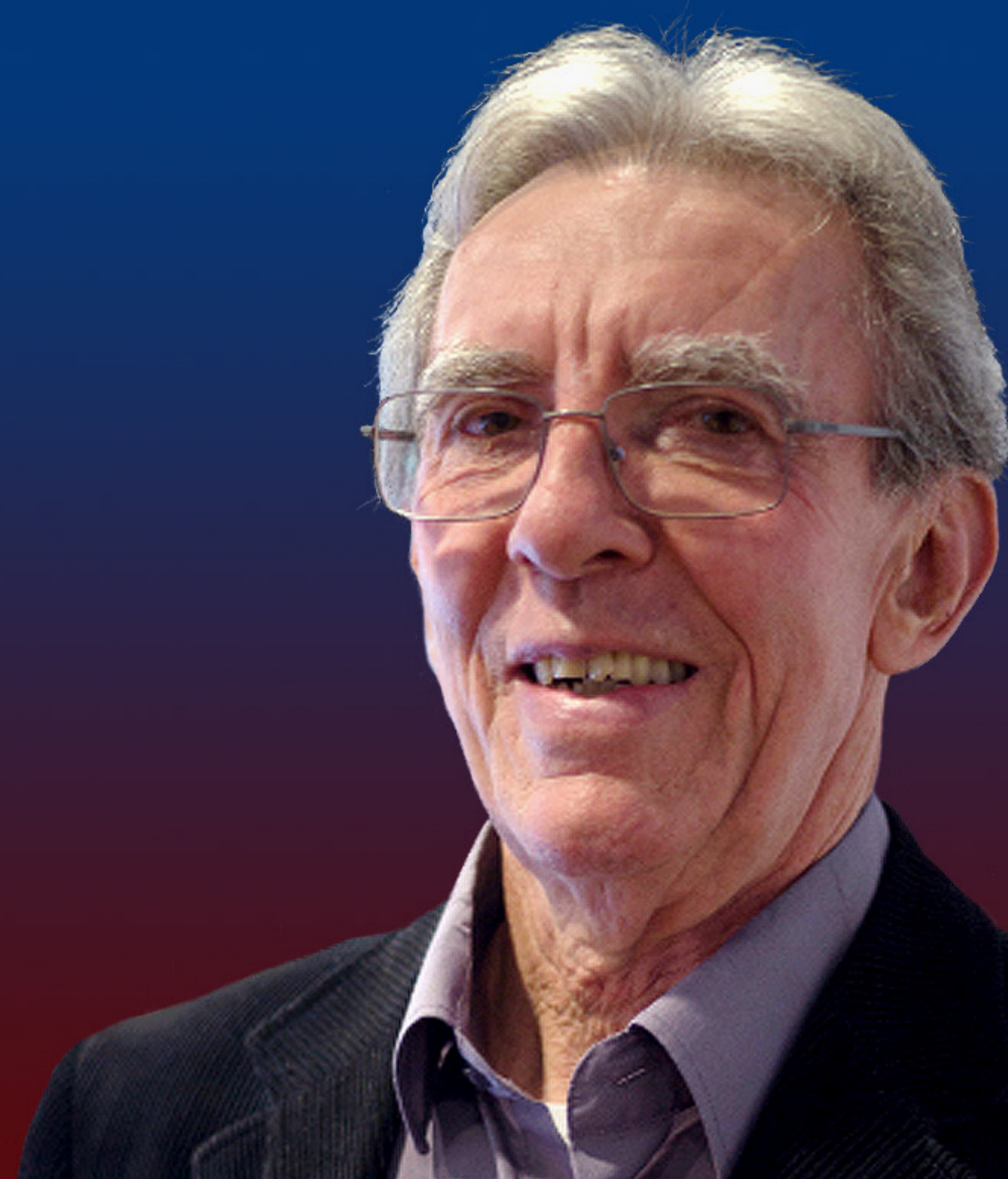
Jean-Pierre SAUVAGE Università di Strasburgo