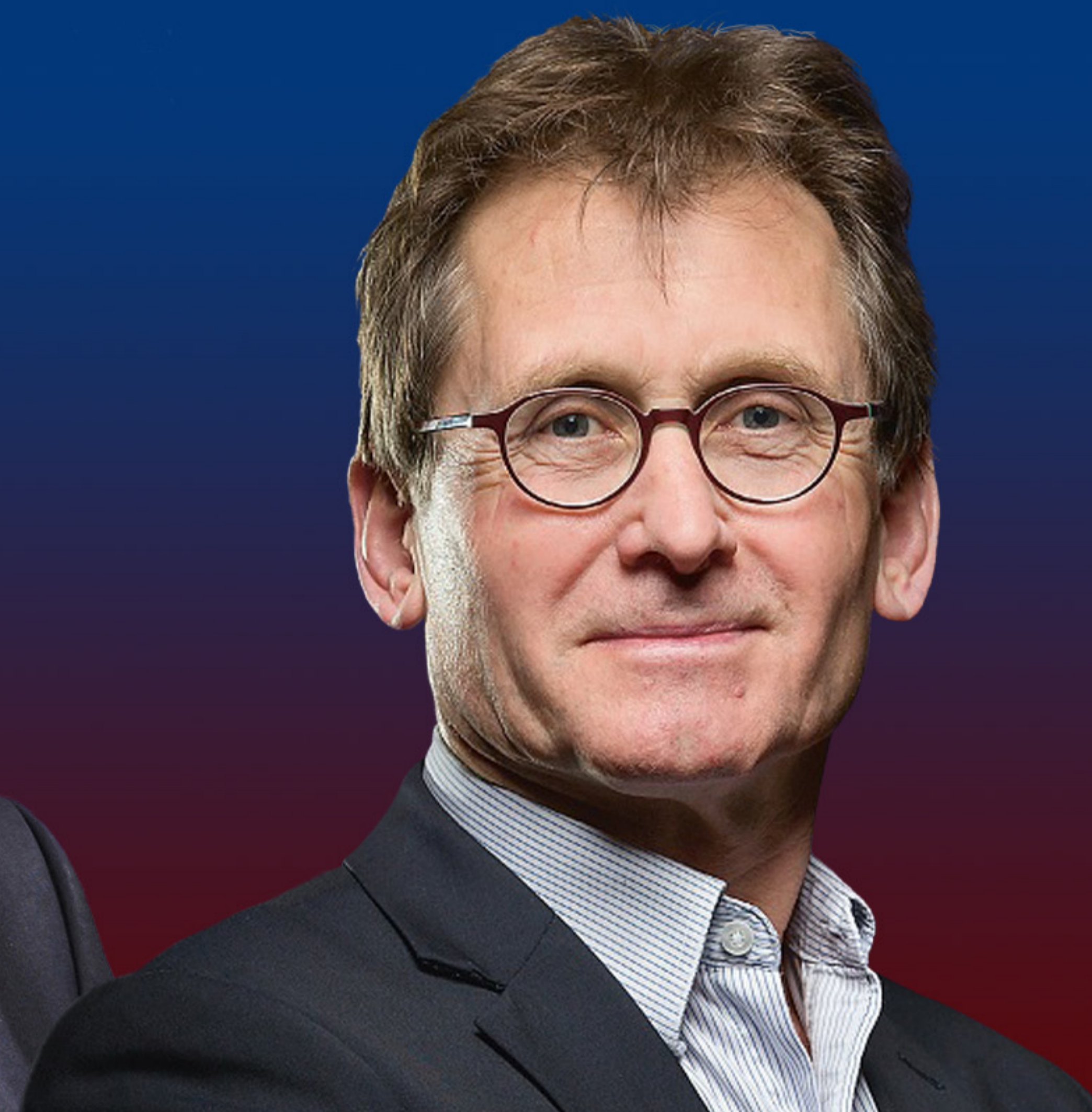
Ben L. FERINGA Università di Groningen

Incontro con i Premi Nobel per la Chimica 2016